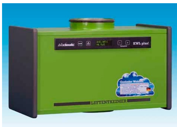
Green Technology in bestem Design. Kompaktes und platzsparendes Gehäuse mit klar strukturiertem und informativem Bedienfeld.

Auch die Montage ist denkbar einfach vorbereitet. Als ideale Ergänzung lässt sich VIROXX®-KWL plus! an alle neuen oder vorhandenen KWL-Anlagen anschließen. Wenige Schritte genügen, um ein perfektes WOHNfühl-Klima und eine außergewöhnliche Raumlufthygiene zu erreichen. Lassen Sie sich beraten. Wir informieren Sie zu allen Fragen zu Gerät und Einbau.