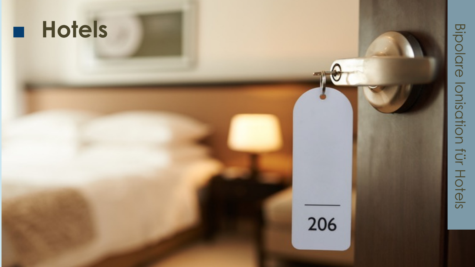
Verbesserung der Raumluft durch Bipolare Ionisation (bioclimatic)